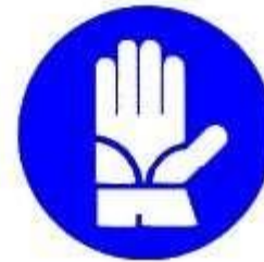
Guanti di protezione obbligatoria