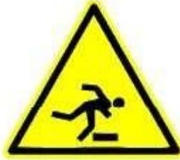
Pericolo di inciampo