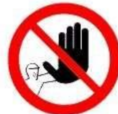
Divieto di accesso alle persone non autorizzate