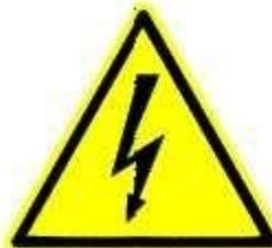
Tensione elettrica pericolosa