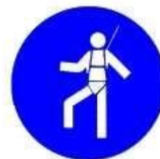
Protezione individuale obbligatoria contro le cadute