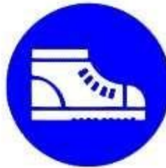
Calzature di sicurezza obbligatoria