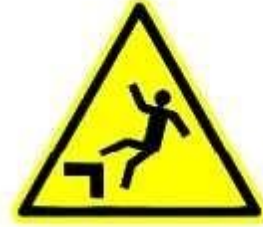
Caduta con dislivello