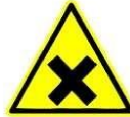
Sostanze nocive o irritanti