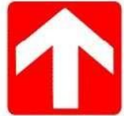
Direzione da seguire (Cartello da aggiungere a quelli che precedono)