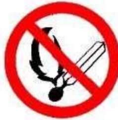
Vietato fumare o usare fiamme libere