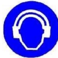
Protezione obbligatoria dell'udito