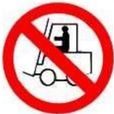
Vietato ai carrelli di movimentazione