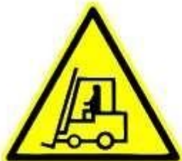
Carrelli di movimentazione