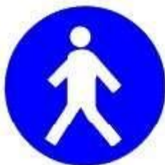
Passaggio obbligatorio per i pedoni