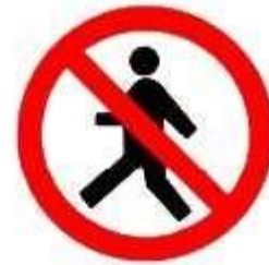
Vietato ai pedoni