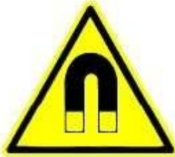
Campo magnetico intenso