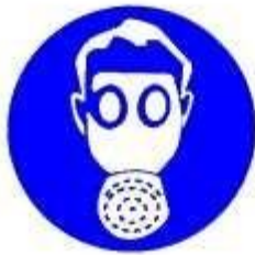
Protezione obbligatoria delle vie respiratorie