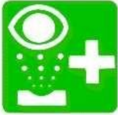
Lavaggio degli occhi