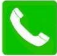
Telefono per salvataggio e pronto soccorso