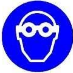
Protezione obbligatoria degli occhi