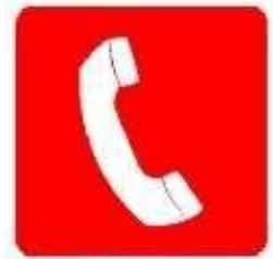
Telefono per interventi antincendio