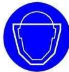
Protezione obbligatoria del viso