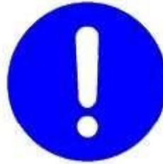
Obbligo generico con eventuale cartello supplementare