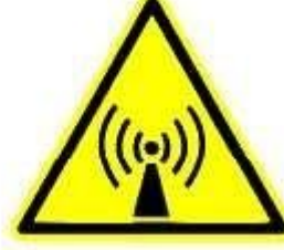
Radiazioni non ionizzanti