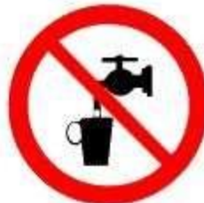
Acqua non potabile