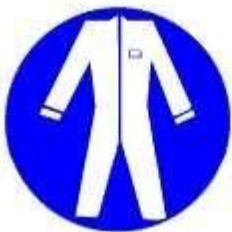
Protezione obbligatoria del corpo