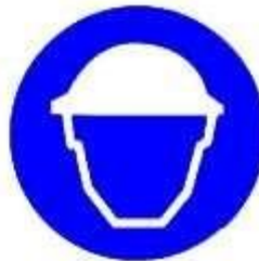
Casco di protezione obbligatoria