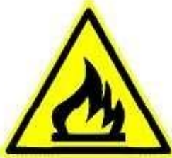
Materiale infiammabile o alta temperatura