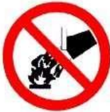
Divieto di spegnere con acqua